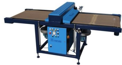
forno UV modello MINI ☞