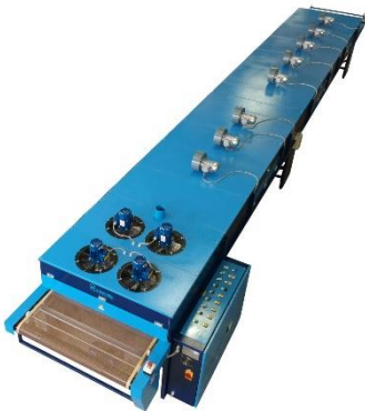
☞ forno IR e aria calda modello COMBI