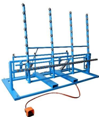
☞ tavolo ribaltabile pneumatico