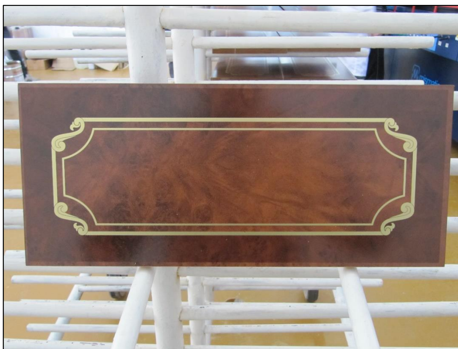
cassetto stampato a due colori (marrone scuro e oro)

Al fine di migliorare costantemente il suo prodotto, Mismatic si riserva il diritto di modificare senza preavviso equipaggiamenti, concezione o dati tecnici.