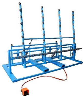
↻ tavolo ribaltabile pneumatico