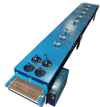
forno IR e aria calda ↻ modello COMBI